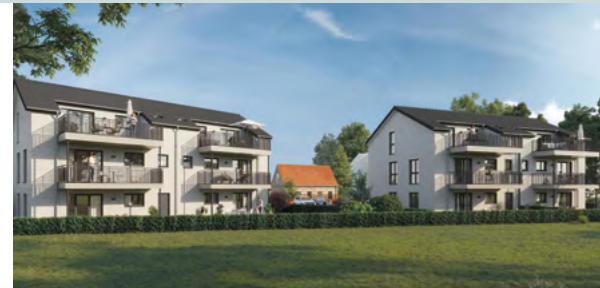
„Dahmer Dünen“ - zwei Mehrparteienhäuser mit jeweils sechs Ferienwohnungen