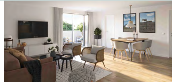
„Das Herz von Kellenhusen“ - Mehrparteienhaus mit 18 Ferienwohnungen u. Gewerbeeinheit